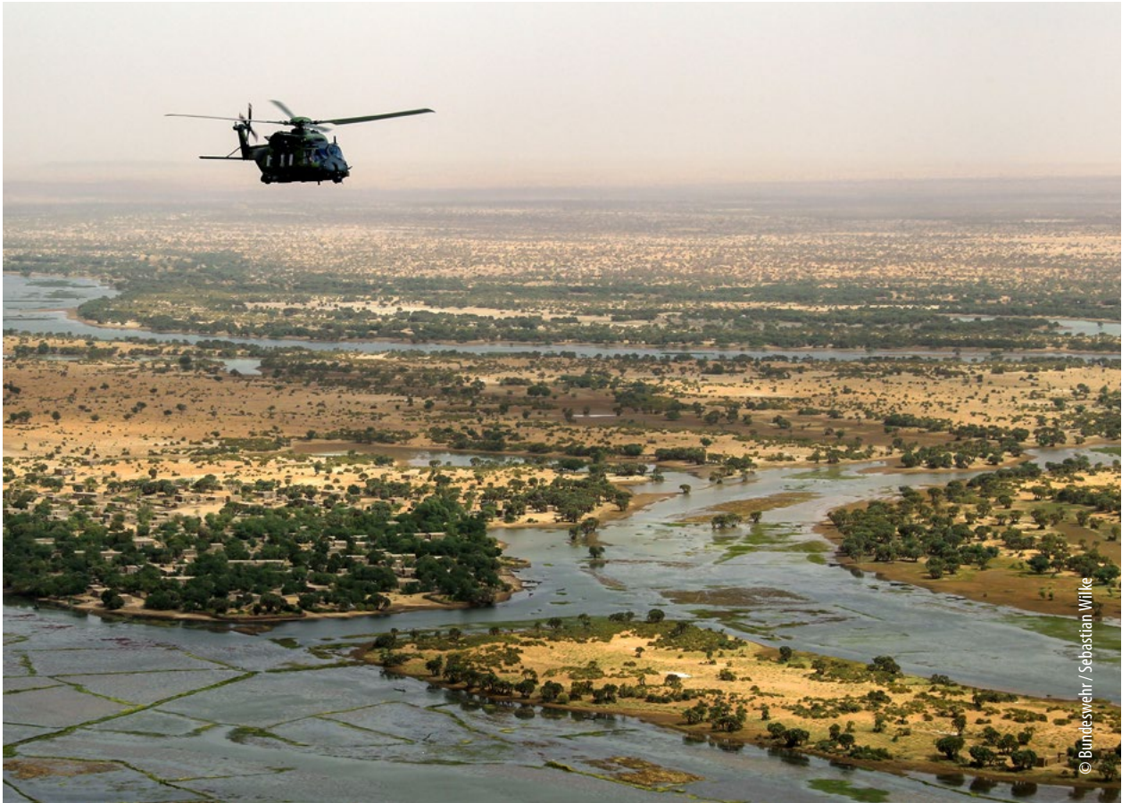
Abb. 1 Mehrzweckhubschrauber NH-90 fliegt in der Nähe von Gao im Rahmen der UN-Mission MINUSMA, am 06.02.2017.

Aufgrund der absehbaren negativen Auswirkungen und Folgen des Klimawandels kann dies nicht wie bisher in einzelnen Politikfeldern passieren; es bedarf einer grünen Revolution die alle politischen, ökonomischen und gesellschaftlichen Bereiche umfasst und diese radikal reformiert. Zweitens soll Europa durch eben jene grüne Revolution wirtschaftliche Impulse erhalten und einen ökonomischen Aufschwung erleben. Neben dem Schutz der Umwelt ist der Green Deal also auch als Revitalisierungsprogramm für die EU-Wirtschaft zu verstehen. Ursprünglich galt es, die paralysierenden Effekte der Banken- und Staatenkrise der 2010er Jahre zu überwinden. Nunmehr wird der Green Deal auch als Post-Corona-Plan verstanden. Der durch den Green Deal gewonnene technologische Forschungs-, Innovations- und Entwicklungsvorsprung hat zum Ziel, nicht nur eine ökologische Vorreiterrolle der EU zu etablieren, sondern die Union im globalen Vergleich nachhaltig wettbewerbsfähig zu halten.